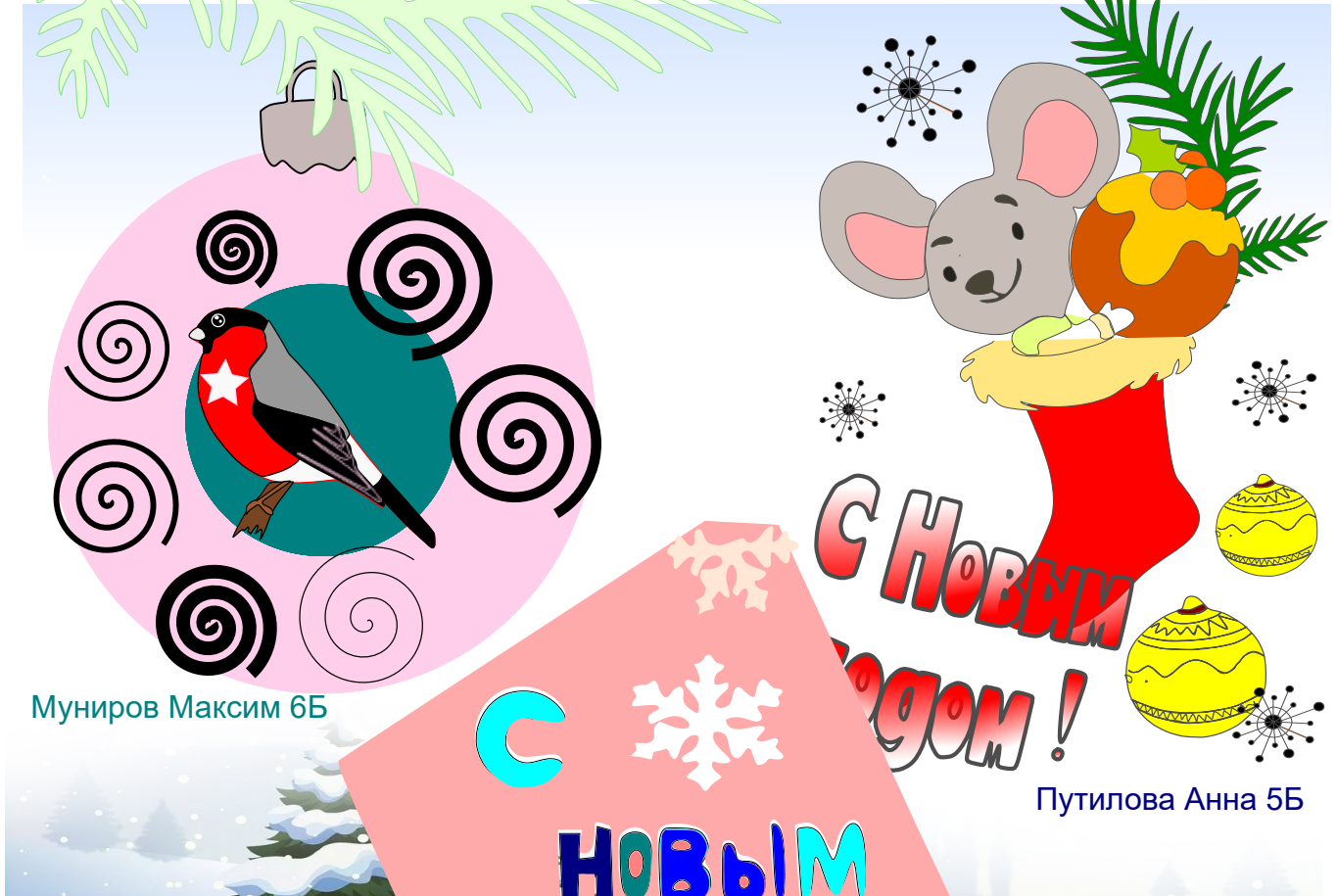
Муниров Максим 6Б