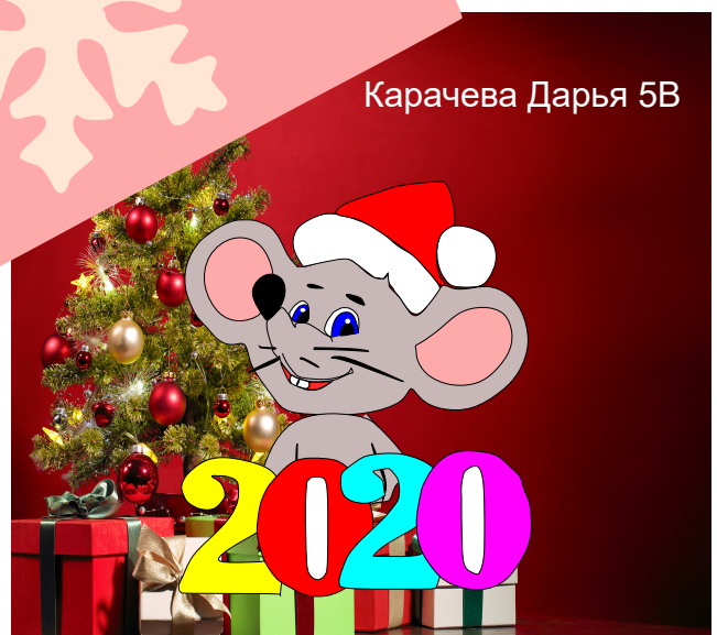
Карачева Дарья 5Б